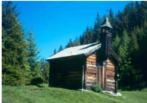
Drei Waller Kapelle

Über den Bernkogelbach und nun über sonnige Hänge bergauf stets den Güterweg folgend Richtung Drei Waller bis zur Huberalm. Hier links einen Wanderweg als Abkürzung bis man wieder zum Güterweg kommt, oder gleich den Güterweg weiter, vorbei an der „Calcit-Höhle“ - eine Kristallhöhle mit vielen Kalziten - nun in westlicher Richtung bis rechts der Wanderweg zur Drei Waller Kapelle abzweigt. Der Wanderstempel ist an der Kapelle angebracht. Ab der Drei Waller Kapelle kann in ¼ Stunde die Kögeralm erwandert werden. Von der Kapelle führt ein Güterweg in nordwestlicher Richtung anfangs leicht bergab, dann eben bis zur Kögeralm. Schöne Aussicht in das Salzachtal sowie zum Hochkönig und zum Steinernen Meer.