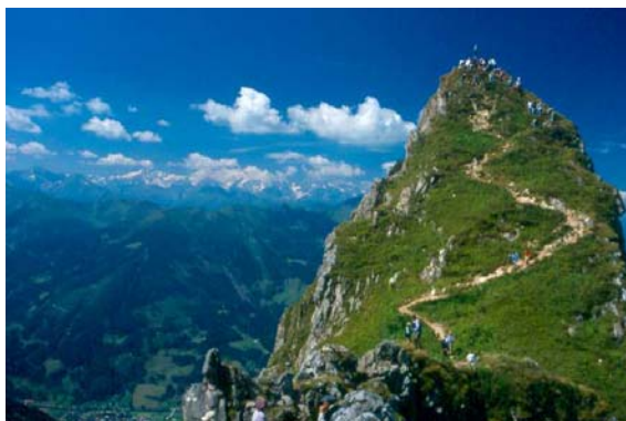
La vetta dello Schuhflicker

Mentre la zona meridionale delle Valle di Gastein è formata da roccia primitiva, qui troviamo la roccia calcarea e pertanto una flora diversa, molto variopinta.