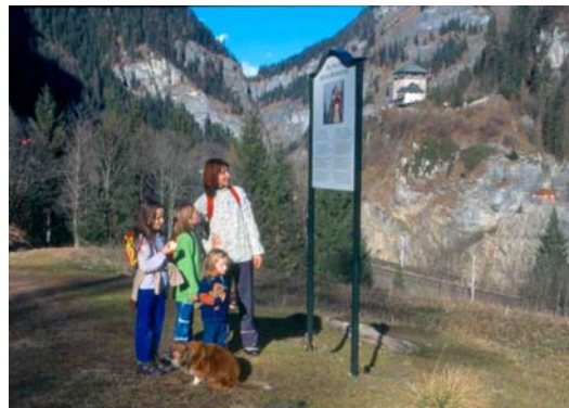
Sulla Via delle Saghe

Dalla frazione Unterberg il sentiero segnato (carrareccia) parte dietro la fattoria Amoserhof e porta a destra. Lungo l'itinerario si trovano 10 pannelli che illustrano con testi e immagini le saghe di Gastein. Il percorso attraversa il torrente Bernkogelbach, sale un breve tratto ripido e prosegue per lo più in piano e in leggera discesa in direzione nord. Il sentiero – bello, perché molto vario - conduce per tratti attraverso il bosco e in gran parte attraverso prati e pascoli fino alla trattoria "Gasthof zur Ruine" a Klammstein, passando dalla "Schlossalm" (timbro presso una panchina) e dalla centrale elettrica. Si può ritornare a Dorfgastein con l'autobus delle linee postali.