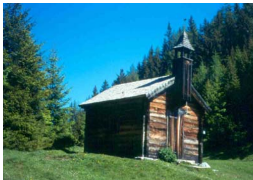
La cappella Drei Waller

Dalla frazione Unterberg si percorre in salita la carrareccia che passa dietro la fattoria Amosergut. Si segue la carrareccia in direzione Drei Waller, che attraversa prima il torrente Bernkogelbach e poi soleggiati pendii, fino alla malga Huberalm. Da qui si può accorciare il percorso seguendo il sentiero sulla sinistra fino a raggiungere nuovamente la carrareccia oppure rimanere sulla carrareccia, passando per la grotta di calcite. Proseguire ora in direzione ovest fino al punto in cui a destra si dirama il sentiero per la cappella Drei Waller. Il timbro è apposto sulla cappella. Da qui si può raggiungere la malga Kögerlalm in un quarto d’ora seguendo la carrareccia in direzione nord-ovest, inizialmente in leggera discesa, poi su un tratto piano. Bella vista panoramica sulla Valle del Salzach, l’Hochkönig e lo Steineres Meer.