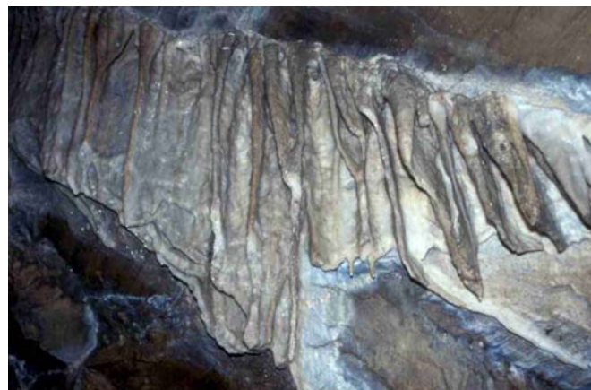
Le concrezioni all'interno della grotta

La Entrische Kirche è una grotta naturale con suggestive concrezioni che durante le guerre dei contadini nel XVI° secolo offrì rifugio ai protestanti perseguitati. La grotta è stata esplorata per diversi chilometri; circa 500 metri sono assicurati e percorribili durante la visita guidata. Si accede alla grotta in circa 50 minuti partendo dal parcheggio di Klammstein